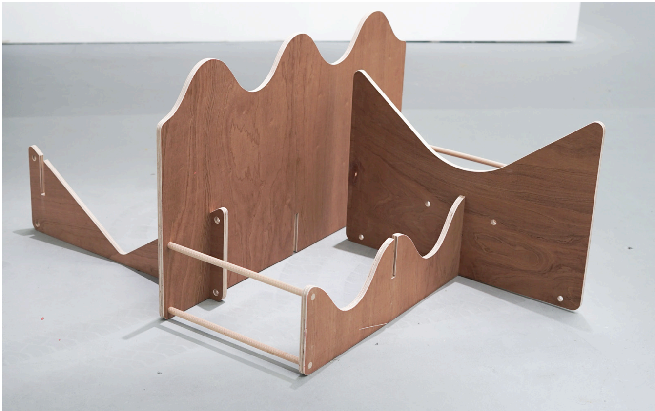
All work n play (2018) taille variable bois